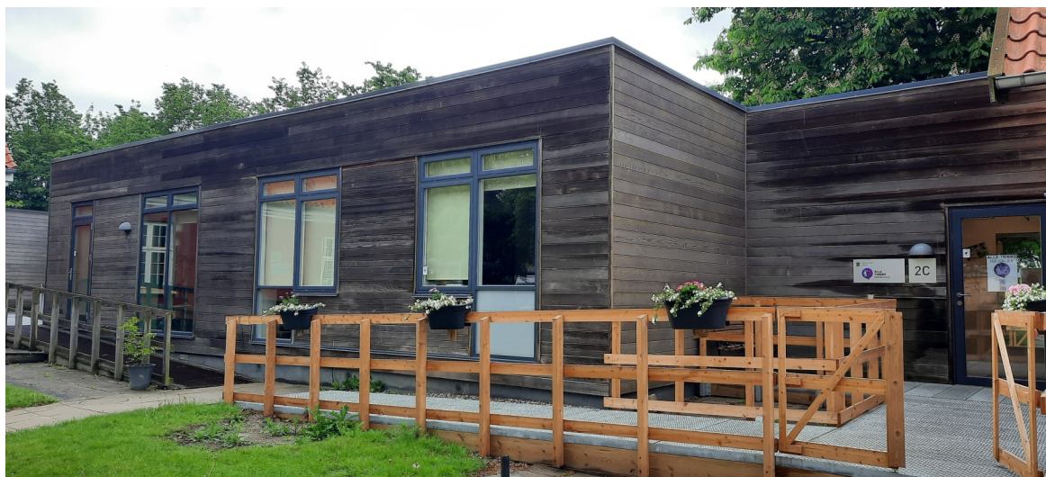
Alle Tiders Højskole Københavnsvej 266